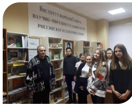
МУЗЕЙ ИСТОРИИ ИНСТИТУТА НАРОДОВ СЕВЕРА