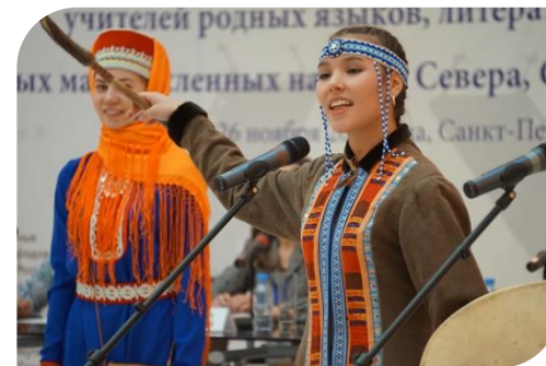
ФОЛЬКЛОРНЫЙ ТЕАТР-СТУДИЯ «СЕВЕРНОЕ СИЯНИЕ»