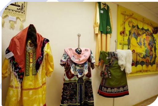
КАБИНЕТ ДЕКОРАТИВНО- ПРИКЛАДНОГО ИСКУССТВА И ХУДОЖЕСТВЕННЫХ ПРОМЫСЛОВ НАРОДОВ СЕВЕРА